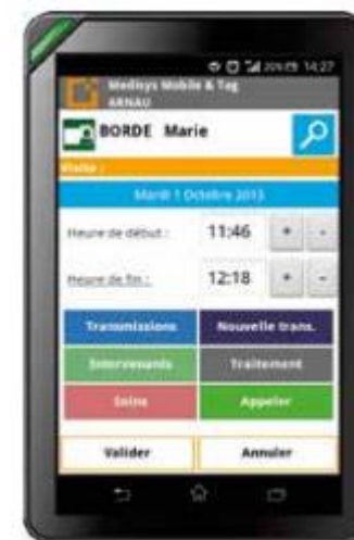
Un smartphone dédié à la télégestion.